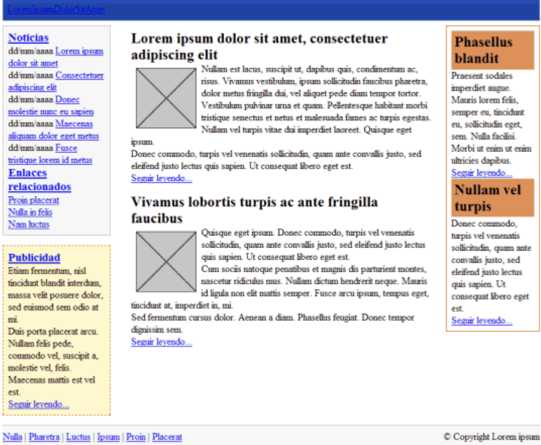
Figura 15.7 Página con colores e imágenes de fondo