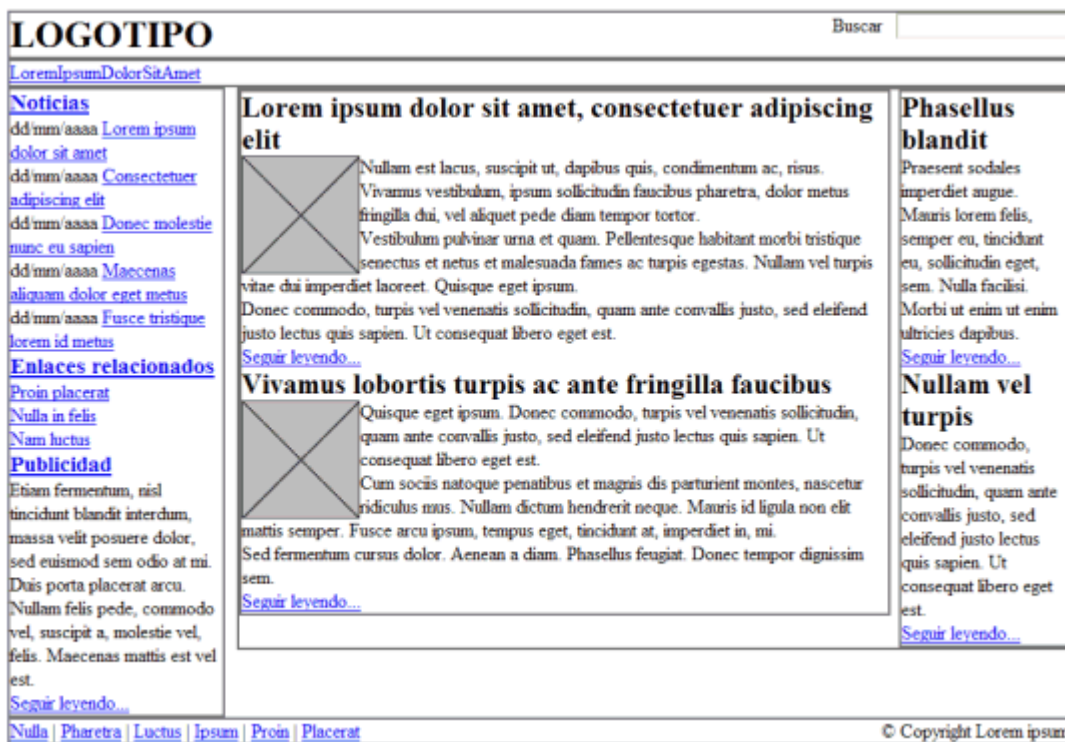
Figura 15.2 Página original

Ejercicio 3. A partir del código HTML y CSS proporcionados, determinar las reglas CSS necesarias para añadir los siguientes márgenes y rellenos: