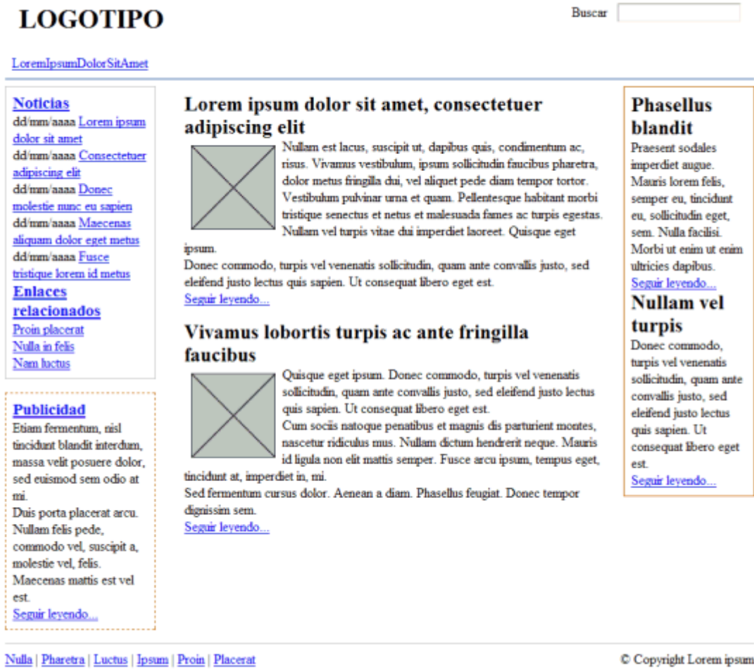
Figura 15.6 Página original

A partir del código HTML y CSS proporcionados, determinar las reglas CSS necesarias para añadir los siguientes colores e imágenes de fondo: