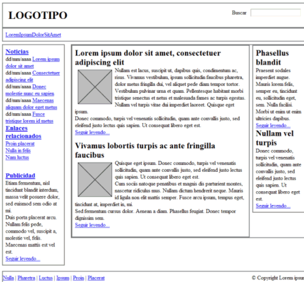
Figura 15.3 Página con márgenes y rellenos